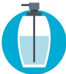
USAR JABÓN H