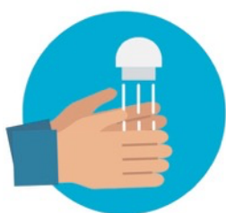
LAVADO FRECUENTE DE MANOS